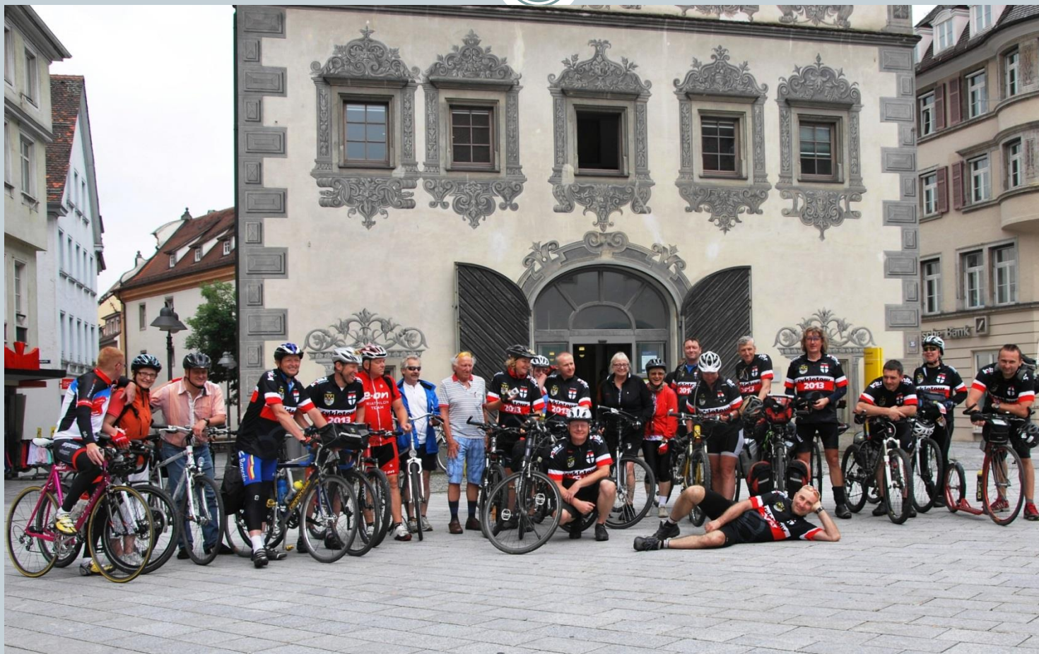
Ravensburg – setkání s kostnickými cyklisty

neděle 7.7. po snídani odjezd busem do Tábora